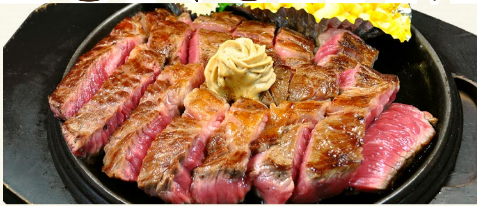
1.Chuck eye-roll steak