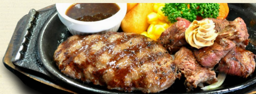
5.Dice-cut steak & Beef Hamburger steak