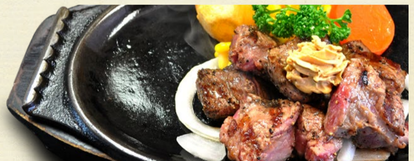
6.Assorted Dice-cut steak