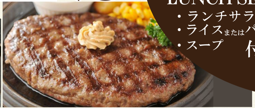
2.Beef Hamburger steak