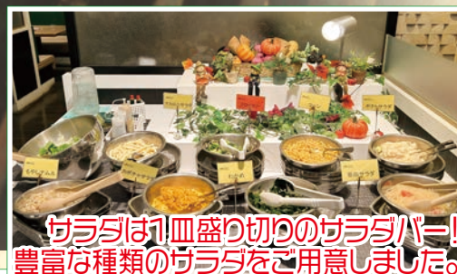
サラダは1皿盛り切りのサラダバー! 豊富な種類のサラダをご用意しました。