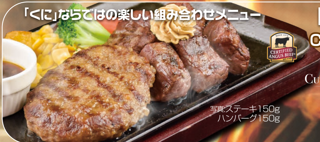
写真ステーキ150g ハンバーグ150g